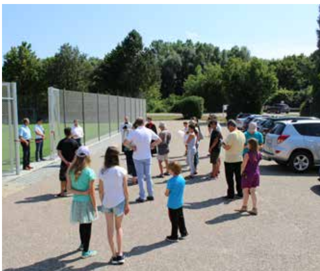
Zuhörer bei der Eröffnung des neuen Kunstrasenplatzes

Alle drei Bürgermeister der Marktgemeinde durchschnitten anschließend gemeinsam ein rotes Band am Eingang des Bolzplatzes und nahmen so im Beisein weiterer Marktgemeinderatsmitglieder, vielen Besucherinnen und Besuchern und vor allem vieler Kinder, symbolisch die offizielle Eröffnung vor und wünschten viele und gute gemeinsame Spiele. Der Markt spendierte aus diesem freudigen Anlass Bratwürste, Getränke sowie ein Eis für Jedermann.