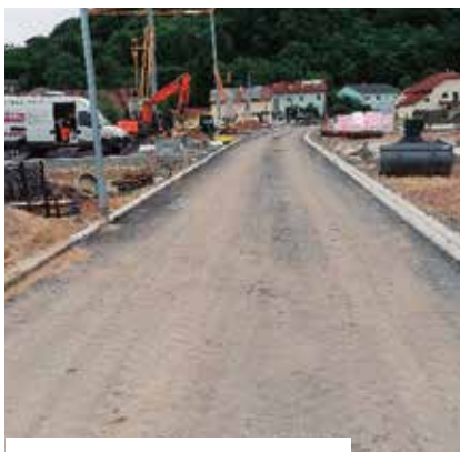
Das neue Baugebiet in der Bayerwaldstraße nimmt Formen an.