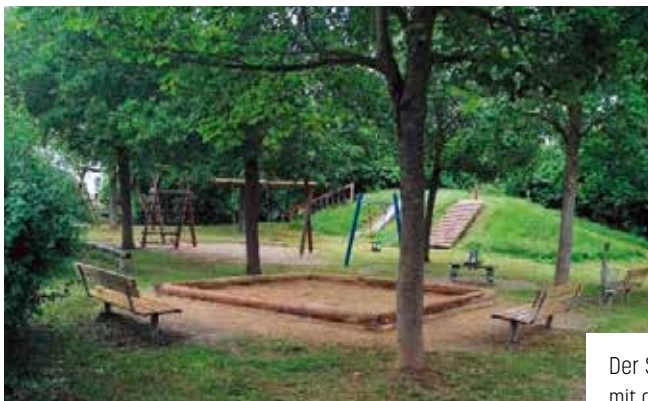
Der Spielplatz in der Gerhardingerstraße ist nach dem Befall mit dem Eichenprozessionsspinner wieder bespielbar.