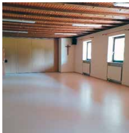
Das Sportheim in Sulzbach erstrahlt im neuen Glanz