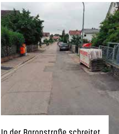
In der Baronstraße schreitet der Neubau der Wasserleitung zügig voran.

Die FF Sulzbach a.d.Donau hat für ca. 55.000,00 € einen Mannschaftstransportwagen beschafft. Der Markt Donaustauf hat davon 22.000,00 € übernommen. Die Übergabe und Segnung des Fahrzeugs erfolgte coronabedingt im kleinen Rahmen. Eine offizielle Einweihung ist zu einem späteren Zeitpunkt geplant.