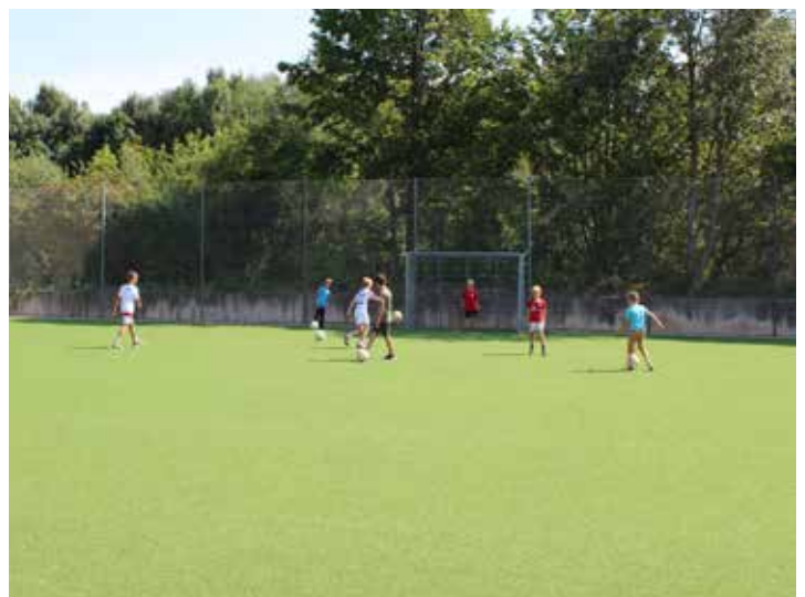
Kinder testen den neuen Bolzplatz