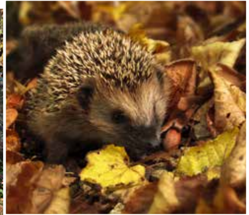
Laub kann viel mehr, als hübsch aussehen