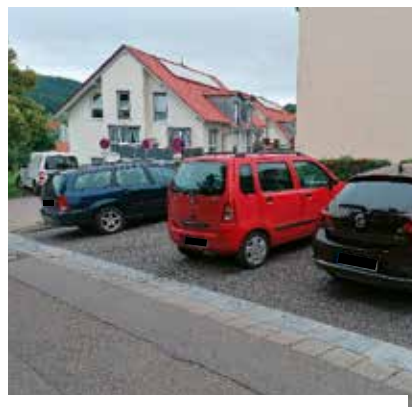
In der Rembrandtstraße wurden 4 neue Parkplätze geschaffen.