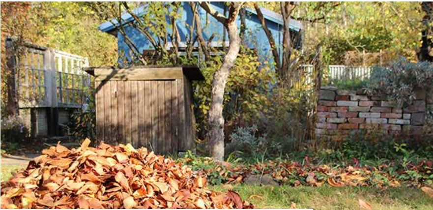
Anm. der Redaktion: Text von M&BU