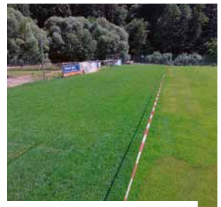
Am Sportplatz in Sulzbach wächst der neue Rasen.